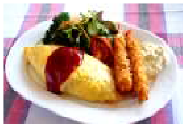
オムライスと海老フライの プレート