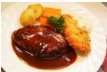
ハンバーグステーキと白身魚フライ