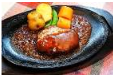
ハンバーグステーキ