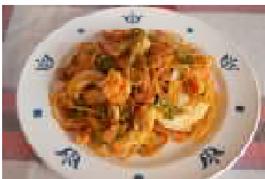
ナポリタンスパゲッティ