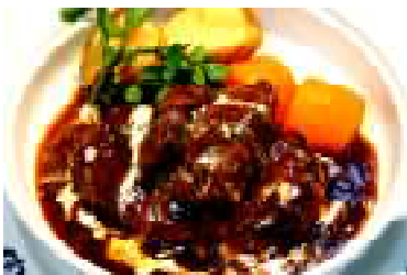
ビーフシチューハンバーグ