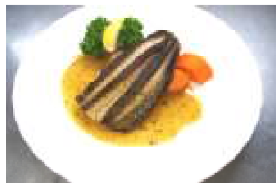
イサキのムニエル