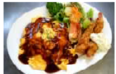
オムレツライスと海老フライの プレート