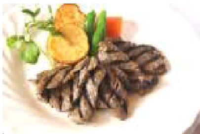
牛フィレ肉の薄切り網焼き