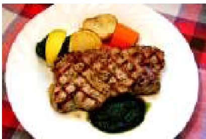
豚ロース肉の厚切りグリル

※ With / salad, bread or rice, coffee or tea or juice