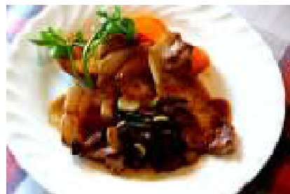
豚ロース肉のポークジンジャー