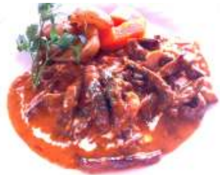
ビーフストロガノフ